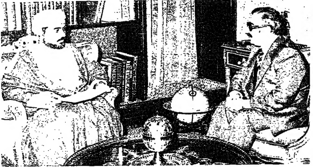
جلالة السلطان قابوس المعظم أثناء استقباله سعادة السفير الأردني

مقابلات جلالة السلطان استقبل حضرة صاحب الجلالة السلطان قابوس المعظم في الساعة الثانية عشرة والدقيقة الثلاثين بعد ظهر أمس الأول بمكتب جلالة بقصر السيب العامر معالي قيس عبد المنعم الزواوي وزير الدولة للشؤون الخارجية. كما استقبل جلالة في وقت لاحق من اليوم نفسه سعادة الدكتور علي خزيمة سفير الإمارات العربية المتحدة لدى السلطنة الذي ودع جلالة بمناسبة انتهاء مهمته كسفير ليلايه لدى البلاط السلطاني. ويعد ذلك استقبال جلالة السلطان المعظم سمو السيد قيس بن طارق بن تيمور. وفي الساعة الثامنة والنصف بعد ظهر اليوم نفسه استقبل جلالة حفظه الله معالي الأستاذ خلفان بن ناصر الوهبي وزير الشؤون الاجتماعية والعمل، ثم استقبل جلالاته معالي الأستاذ محمد الزبير وزير التجارة والصناعة، وفي الساعة الثالثة والنصف استقبل جلالاته معالي الشيخ الوليد بن زاهر الهنائي وزير الأوقاف والشؤون الإسلامية، ثم استقبل جلالاته سعادة السفير أحمد مكي سفير السلطنة المعتمد في فرنسا. كما استقبل جلالاته معالي وزير الصحة.